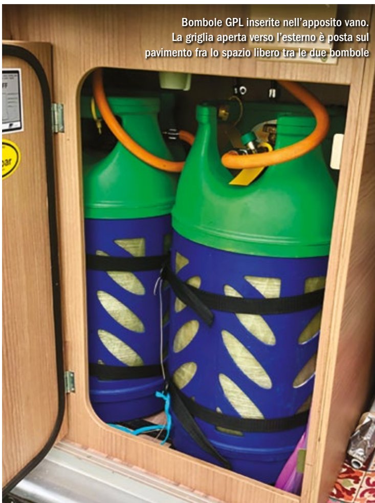
Bombole GPL inserite nell'apposito vano. La griglia aperta verso l'esterno è posta sul pavimento fra lo spazio libero tra le due bombole